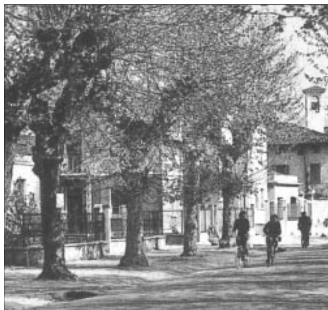
Quando in via Roma c'erano i platani.

Nei prossimi mesi si procederà a realizzare il secondo stralcio di questo progetto che prevederà, fra gli altri interventi, la potature dei filari di piante di Via Roma e il completamento della sostituzione delle piante secche in Via Berlinguer. Maggiori dettagli verranno pubblicati sul prossimo numero del giornale "Roncadelle".