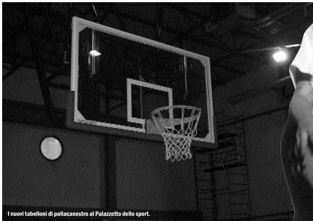
I nuovi tabelloni di pallacanestro al Palazzetto dello sport.