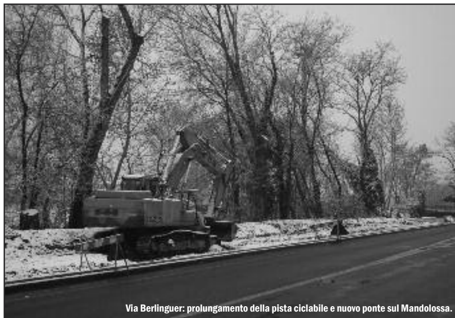
Via Berlinguer: prolungamento della pista ciclabile e nuovo ponte sul Mandolossa.

Per i primi restano i vincoli relativi al rispetto delle dimensioni degli edifici, ma è stato introdotto un nuovo metodo di classificazione degli stessi che, in base allo stato di conservazione, alla rilevanza artistica o storica e all'anno di edificazione, li inserisce in una specifica classe di intervento, alla quale corrispondono in modo oggettivo lavorazioni e vincoli differenti. In parole povere: in caso di edificio di pregio si dovrà procedere ad uno scrupoloso restauro, mentre all'opposto altri fabbricati potrebbero