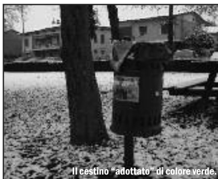
Il cestino "adottato" di colore verde.

La seconda tappa ha previsto che nelle 4 vie centrali del paese (Roma, S. Bernardino, Castello e Cismondi), una volta al mese, si