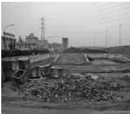
La nuova isola ecologica

cole lavorazioni edili fatte dai cittadini nelle proprie abitazioni, uno per i residui della pulizia delle strade e alcuni contenitori per la raccolta di neon, elettrodomestici contenenti i CFC (dannosi per l'at-