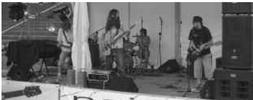
I "Sex" vincitori della prima edizione