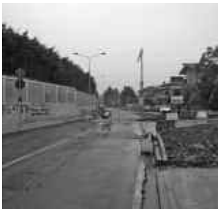
Via Fratelli Cervi

Ampliare la superficie complessiva, aumentare le tipologie di rifiuti da conferire, rendere più facile la differenziazione dei rifiuti: questi gli obiettivi che l'Amministrazione Comunale di Roncadelle si è posta dando il via ai lavori di ampliamento dell'Isola Ecologia di via dell'Artigianato. Il progetto, elaborato dall'Ing. Franco Richiedei e autorizzato dalla Provincia lo scorso 1 febbraio, prevede l'ampliamento dell'Isola Ecologica dagli attuali 1.350 metri quadrati di superficie a 2.040, per consentire un aumento del numero dei container presenti in grado di raccogliere i diversi rifiuti. In concreto, al termine dei lavori potranno essere posizionati due container in più per i rifiuti ingombranti, uno per gli scarti inerti di pic-