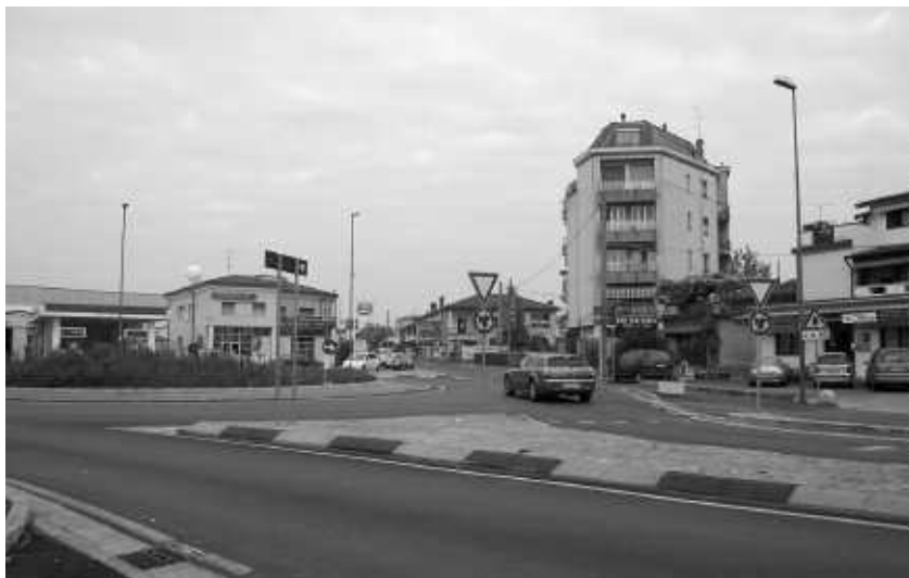
La nuova rotonda della Mandolossa.