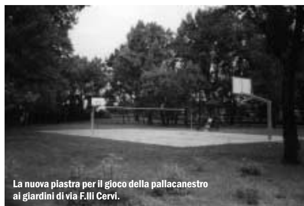
La nuova piastra per il gioco della pallacanestro ai giardini di via F.lli Cervi.