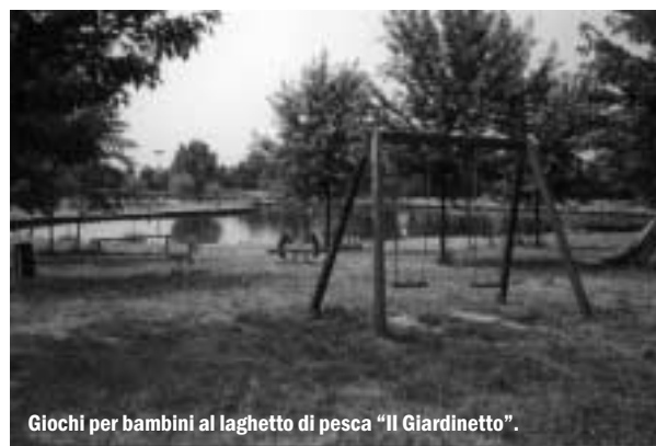
Giochi per bambini al laghetto di pesca "Il Giardinetto".