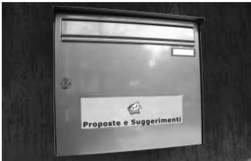
Nella foto la cassetta installata all'ingresso del Municipio in cui è possibile inserire osservazioni e suggerimenti.