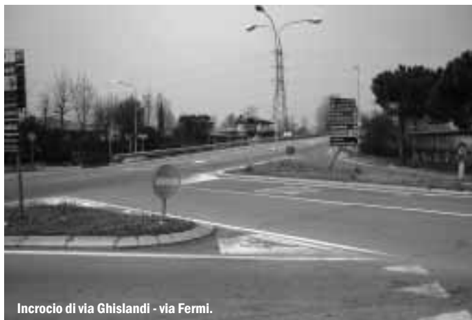
Incrocio di via Ghislandi - via Fermi.