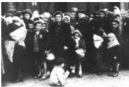
Ebrei deportati in Germania.

Espulsi da vari Stati europei nel Medioevo e spesso ghettizzati nelle grandi città in epoca moderna, gli Ebrei sono stati oggetto di particolare attenzione nell'età illuminista, quando si cercò di favorirne l'integrazione con