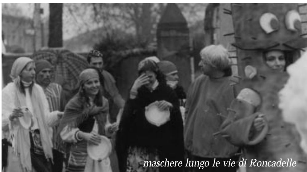
maschere lungo le vie di Roncadelle