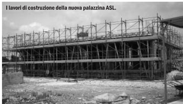
I lavori di costruzione della nuova palazzina ASL.

to è stato molto partecipativo: al contrario di quello che si fa di solito (fai il progetto, lo presenti e poi inizi con i lavori), questa volta abbiamo prima raccolto idee e suggerimenti, poi abbiamo avviato la progettazione, infine si è dato il via ai lavori. Dall'altro lato, abbiamo fatto un importante cambiamento in corsa, rispetto agli intenti iniziali: nell'area dell'ex Elettroplastica abbiamo deciso di evitare l'abbattimento dell'edificio industriale e di utilizzarlo per scopi di pubblica utilità, senza compromettere il previsto ampliamento del cimitero. In ogni caso, il "domino" adesso è partito. Questo speciale vuole proprio fornire a tutti un aggiornamento sul progetto e sullo stato dell'arte dei lavori: quelli terminati, quelli avviati e quelli che verranno. Buona lettura.