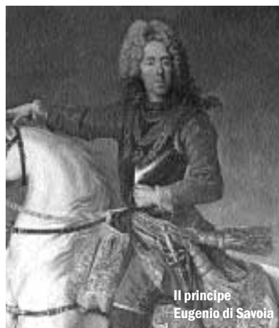
Il principe Eugenio di Savoia