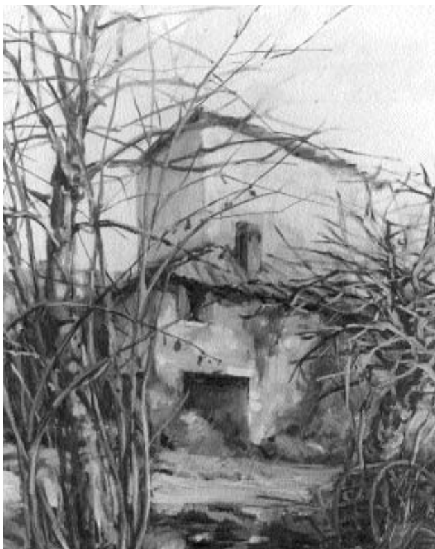
Il vecchio mulino in un quadro del pittore Rivetta

Vista la riuscita funzionale ed elegante della costruzione, pare doveroso complimentarci con chi lo ha curato e portato a termine ed augurare ai nostri cittadini che vi andranno ad abitare, di poterlo godere il più a lungo possibile.